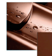
(RAL 8019) brązowy