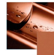
(RAL 8004) ceglasty