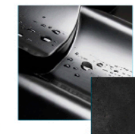
(RAL 9005) czarny